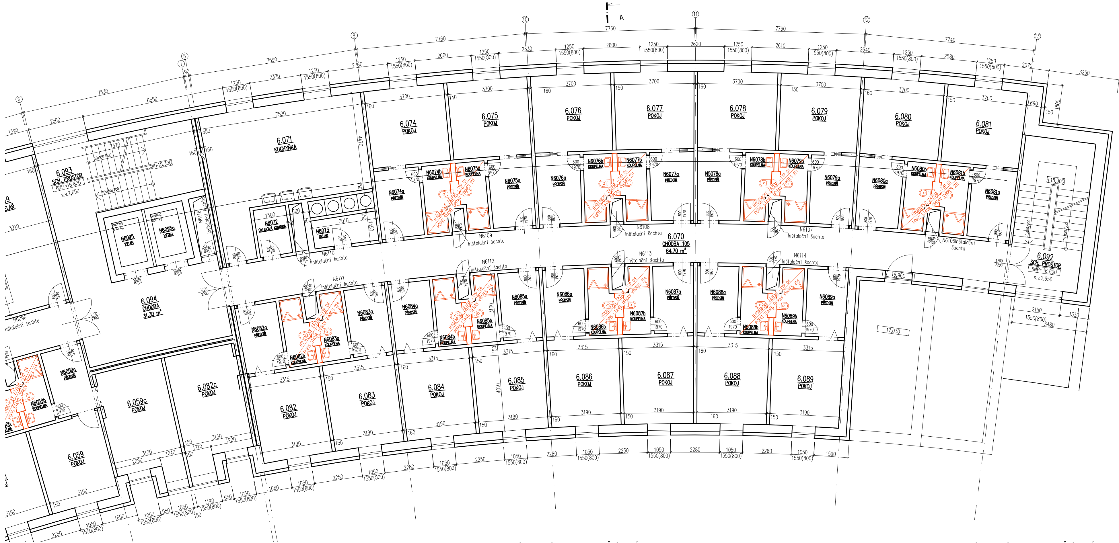
OBJEKT: KOLEJE MENDELU TR. GEN. PÍKY